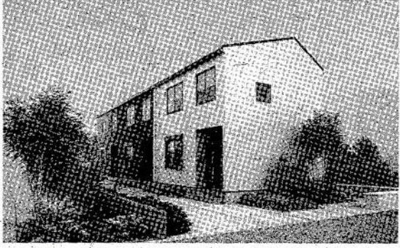
「ぼく・く・ラボ賃貸 DOMO」の外観イメージ

新商品の「ドローモ」は都市部向けの防災配慮型住宅。円筒形状により省スペースで設置可能。階段を取り入れることで、コンパクトな間取りを実現し、シングル層向けのことで、建設費削減に貢献している。