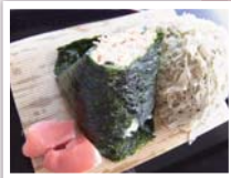
生姜みそむすび&とうろこんぶ

富山県・城端サービスエリアには「ヨッテカレー」というおにぎり屋さんがあります。塩をまぶしただけのシンプルなものから、梅や昆布などの定番のもの、富山県ならではの食材が入ったものなど、種類は豊富です。注文したらその場でにぎってくれるおにぎりはとても温かく、味も絶品です。